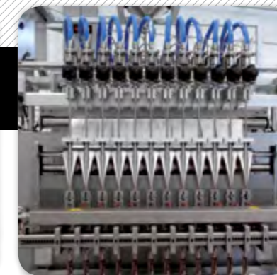
3. Tubs formadors.