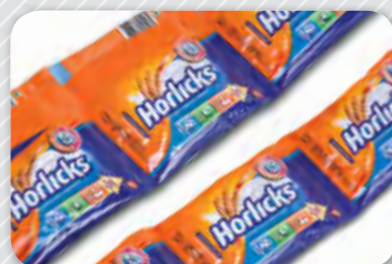
2. En pols.