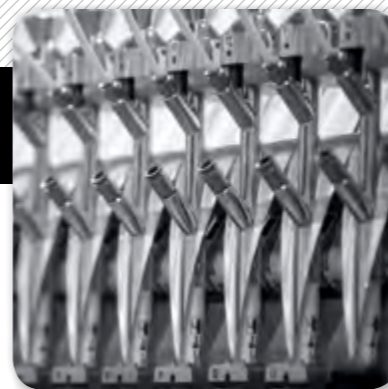
1. Sistema d'aspiració de pols.