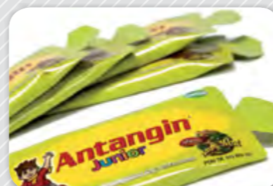
4. Amb forma.