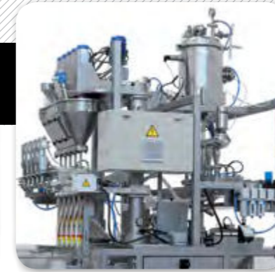
2. Sistema de dosificació de líquids i productes en pols.