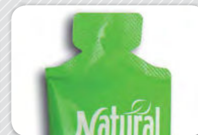
5. Amb forma.