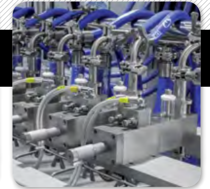
3. Sistema de dosificació de líquids.