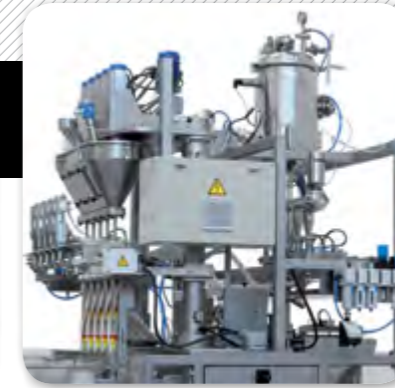
2. Sistema de dosificació de líquids i productes en pols.