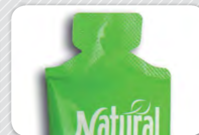
5. Amb forma.