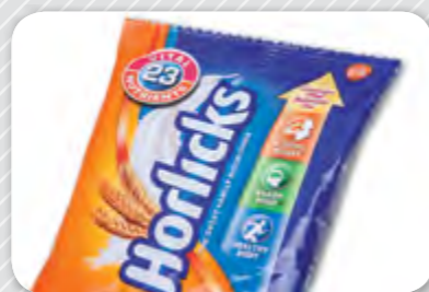
2. En pols.