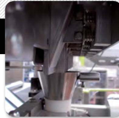
1. Sistema de dosificació de granulats.