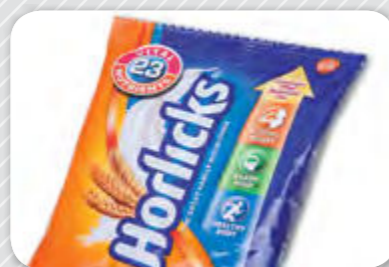
2. En pols.